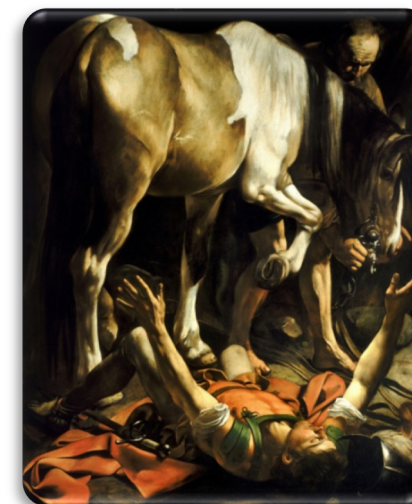
Caravaggio "La Conversione di San Paolo" 1601 Basilica di Santa Maria del Popolo, Roma

SPAZIO DI INCONTRO NELLA FEDE, RIVOLTO A PERSONE SEPARATE, DIVORZIATE O CHE VIVONO NUOVE UNIONI